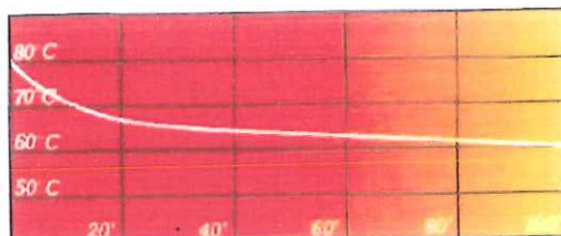
Uchování teploty v minutách

Graficky znázorněné tepelné hodnoty vycházejí z testu provedeného s jídlem o složení: řízek, zelenina, brambory a krémová polévka. Porcelán a komponenty stravy byly při porcování ohřáté na 80°C. Dle druhu a složení jiných jídel se může výsledek nepatrně lišit.