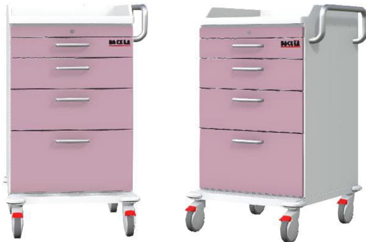
Obrázky jsou ilustrativní