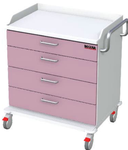
Obrázky jsou ilustrativní