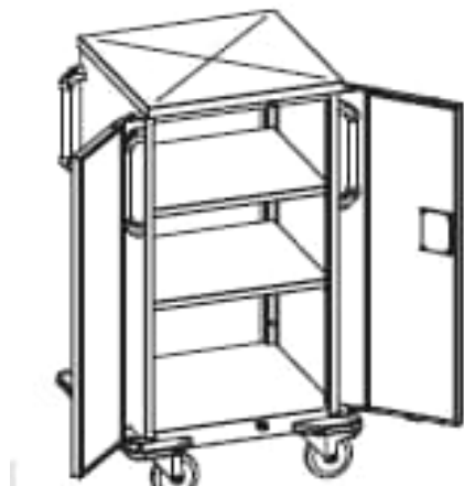
Obrázek je ilustrativní