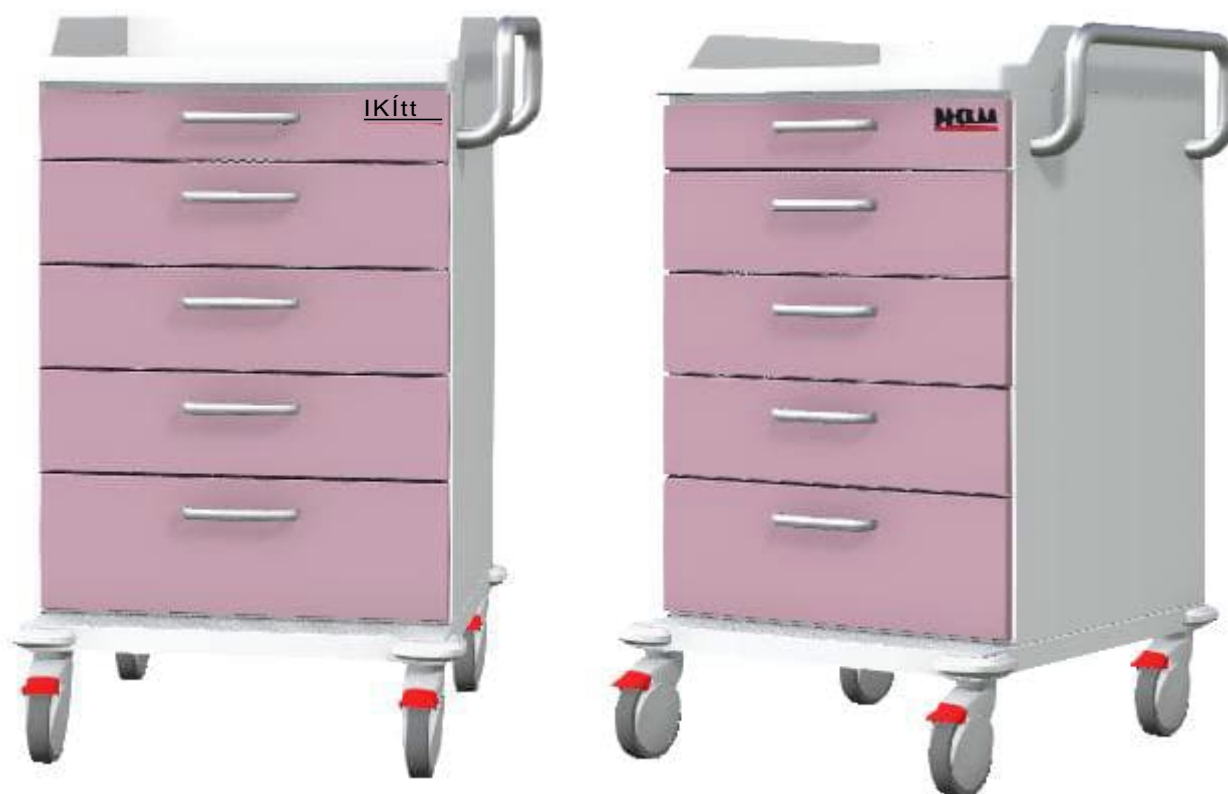
Obrázky jsou ilustrativní