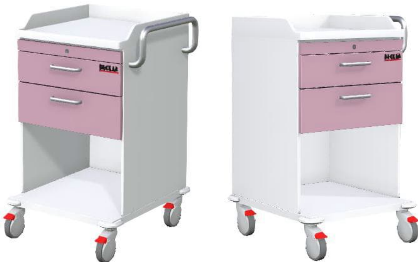
Obrázky jsou ilustrativní