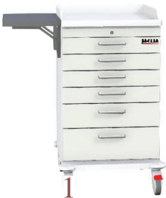
Obrázky jsou ilustrativní