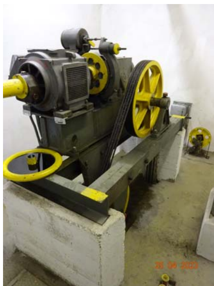
Strojovna výtahu – stroj SB 409 s kladkou