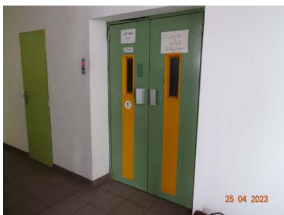
Nástupiště ve výchozí stanici