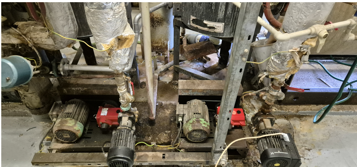
Výměna oběhových čerpadel Grundfos, včetně armatur, potrubí a izolace