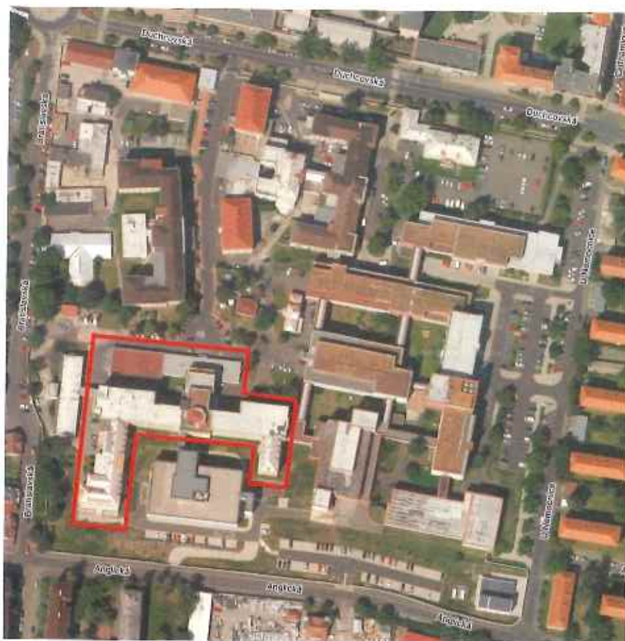
Obrázek 1 – Satelitní snímek posuzovaného objektu