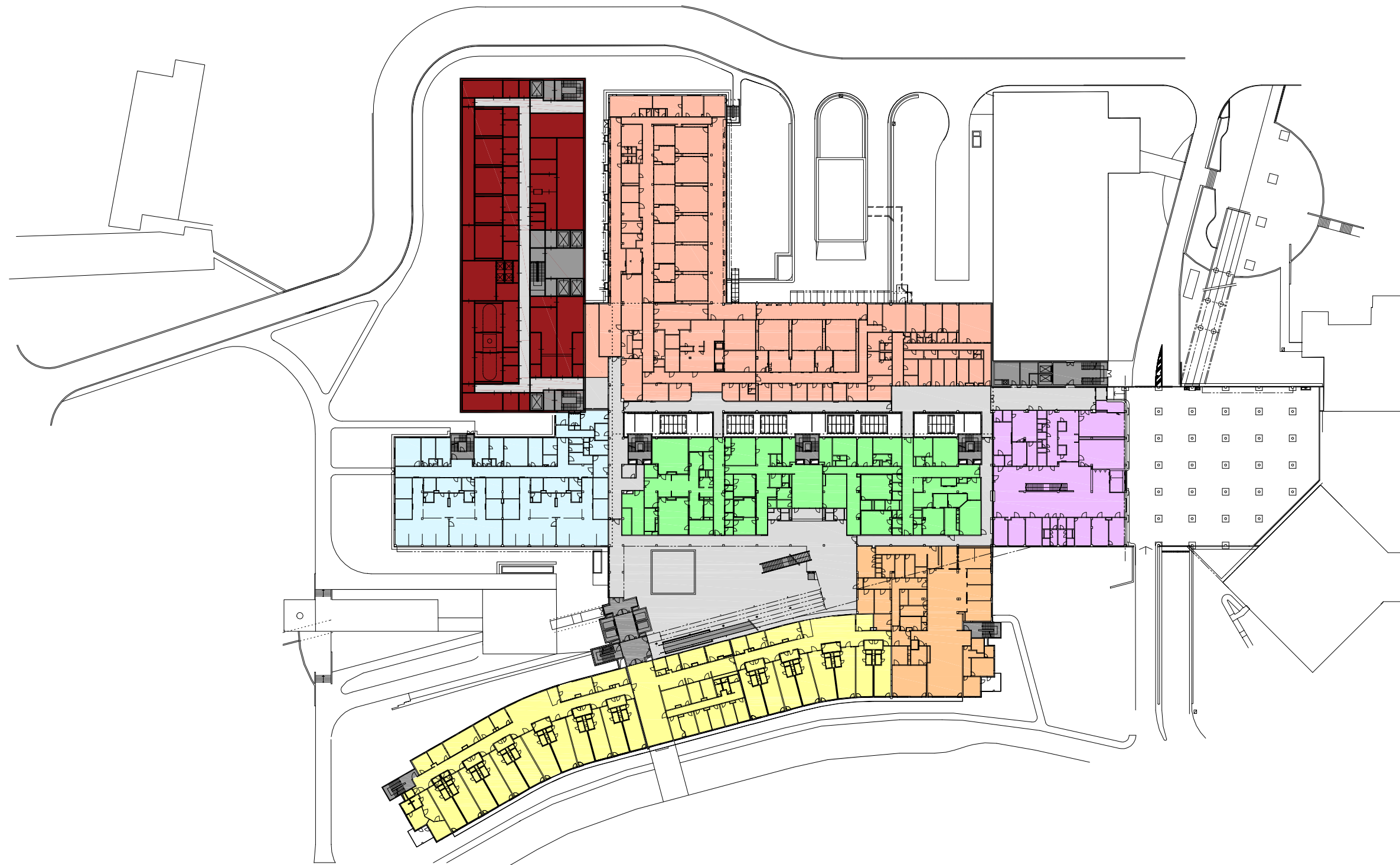
SCHEMA PROVOZŮ LEGENDA: