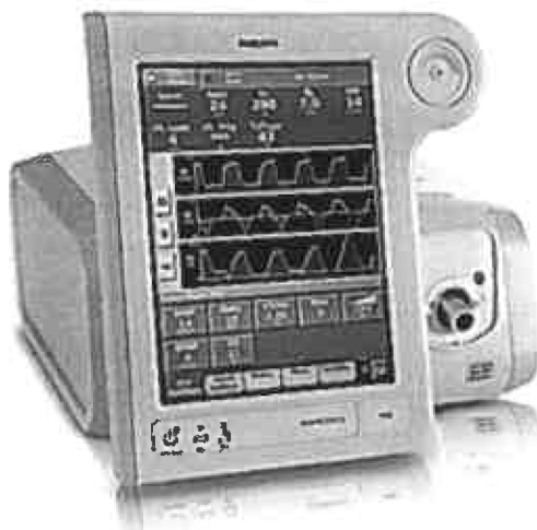
Obrázek: Respironics V60