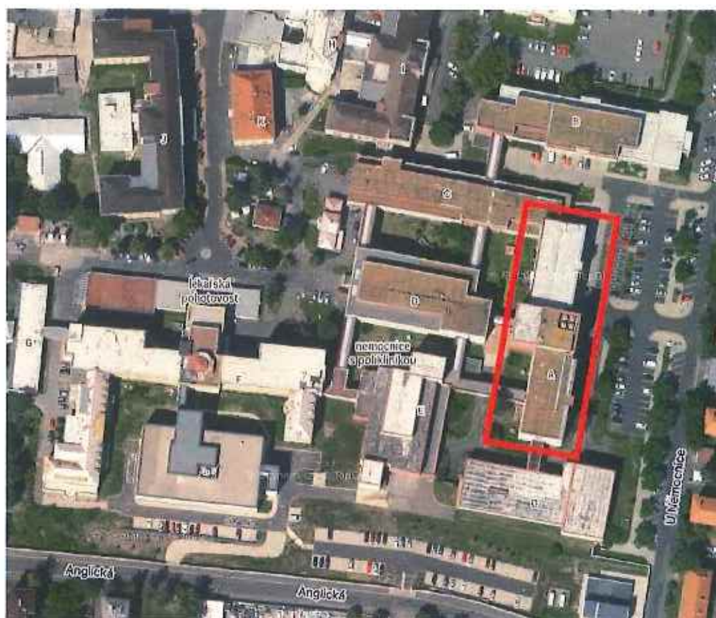
Obrázek 1 – Satelitní snímek posuzovaného objektu