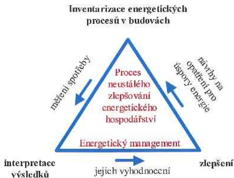
Obrázek 3 – Princip neustálého zlepšování energetického hospodářství

Jedná se o uzavřený cyklický proces neustálého zlepšování energetického hospodářství v budovách, který se skládá z následujících činností: měření spotřeby energie – stanovení potenciálu úspor energie – realizace opatření – vyhodnocení a porovnání velikosti úspor předpokládaných a skutečně dosažených.