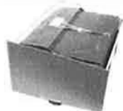
Zásuvka pro náhradní baterie vč. baterií