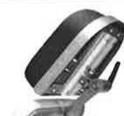
Nárazník hlavové části, nerezový.