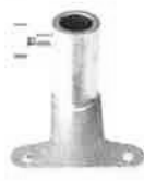
Upínací deska k opěrce zápěstí chirurga 30140000.