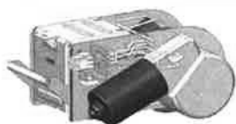
e-drive, přírážka za motorický pojezd