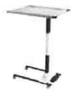
Nástrojový stůlek „supportLine plus“ výškově nastavitelný