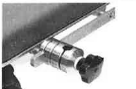
CNS připojovací šroub