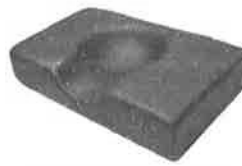
Polštář pro fixaci hlavy s dutinou (Rubínův polštář), 41x25cm, Výška 10cm