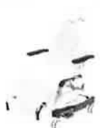
stayClean krytí operačního stolu 200x73cm, box à 160 ks