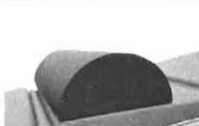
Půlválcový opěrný polštář, 60x28x14cm, PUD povrch