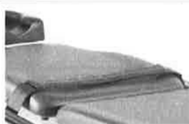
Tělový pás se suchým zipem, 2 dílný