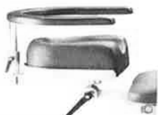
Opěrka zápěstí chirurga nastavitelná, včetně upínací desky 30130000.