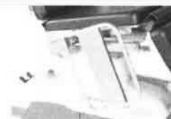
Boční díly levý a pravý, sklopné, včetně uchycení, polstrované