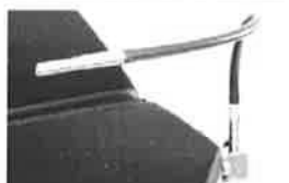
Ohebný držák chirurgického krytí s přívodem kyslíku (nezahrnuje upevňovací šroub 30900000)