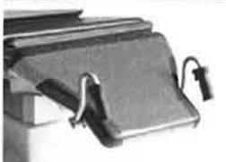
Ochranná folie - nožní část