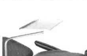
Nástrojový stůlek 50x30x15cm, výškově nastavitelný, odpojitelný