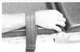
Pásky pro zajištění zápěstí. 1 pár