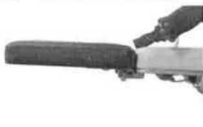
Připojitelný nožní díl, vč. normované kolejničky