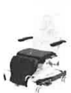
stayClean krytí operačního stolu 10x73cm, box à 240 ks