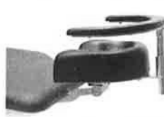
Opěrka zápěstí chirurga nastavitelná, včetně upínací desky 30130000. Sklopná.