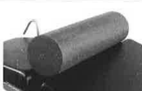
Plně válcový opěrný polštář, 50x15cm, PUD povrch