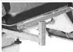
Držák monitoru z nerezové oceli, nesklopný, včetně vysouvacího infuzního stojanu Ø 25mm