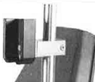
Držák dálkového ovládání z PVC k upevnění na infuzní stojan, Ø 25/18mm