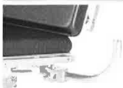
Držák monitoru z nerezové oceli, sklopný, včetně vysouvacího infuzního stojanu Ø 25mm