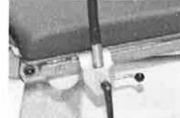
Držák pro upevnění na infuzní stojan Ø 25/18mm, PVC