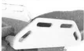
Boční díly levý a pravý, sklopné, včetně rychloupínacího šroubu na normovanou kolejnici, 580x200 mm