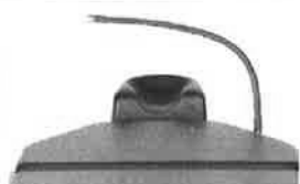
Ohebný držák chirurgického krytí (nezahrnuje upevňovací šroub 30900000)