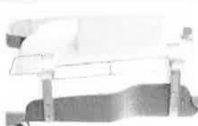
Držák kyslíkové lahve