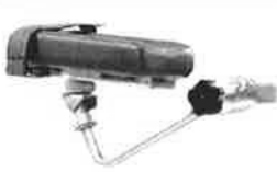
Polstrovaná područka s univerzálním kloubem s pásy pro upevnění předloktí