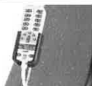
Držák dálkového ovládání z PVC