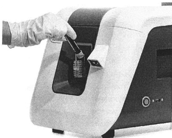
Uzavřený systém dávkování vzorku