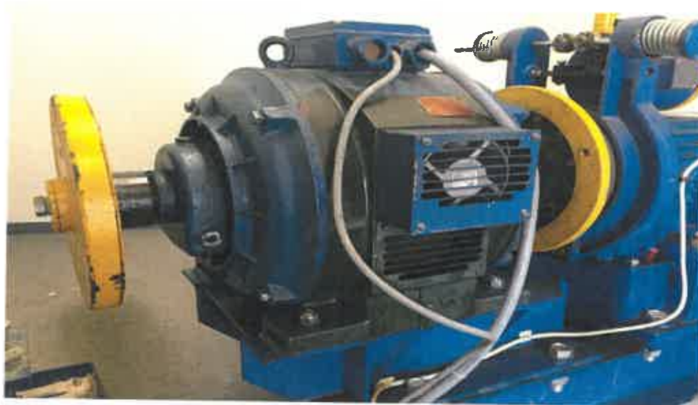
Původní motor Ústí nad Labem

Realizované opravy stejného, nebo podobného rozsahu: Nemocnice Litoměřice, Nemocnice Děčín, Nemocnice Chomutov