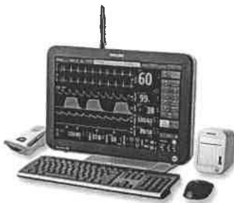
Expression IP5-ilustrační foto

na základě poptávkového řízení Vám zasílám cenovou nabídku na dodání rozšiřujícího LCD dotykového monitoru. Součástí monitoru je kompletní příslušenství potřebné k provozu.